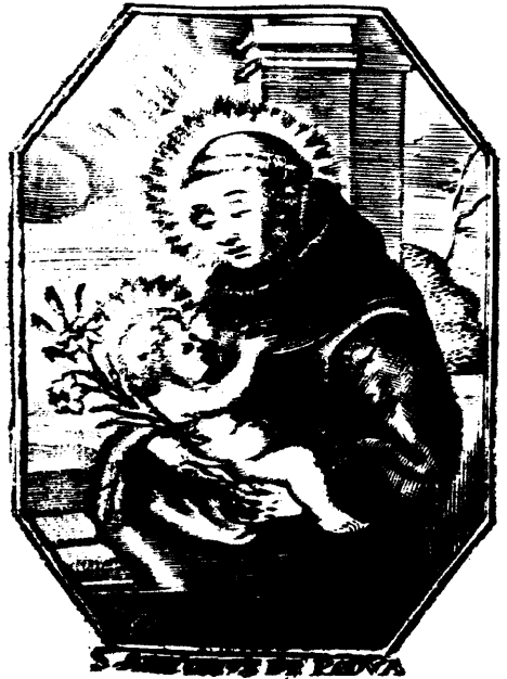
S. ANTONIUS DE PADUA