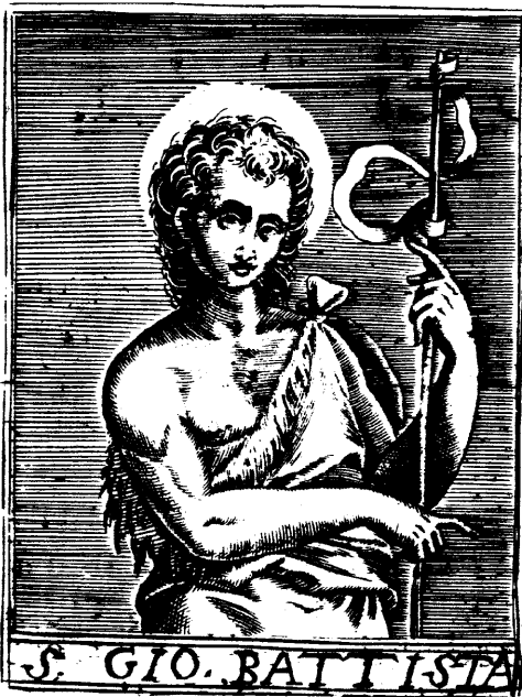
S. GIO. BATTISTA